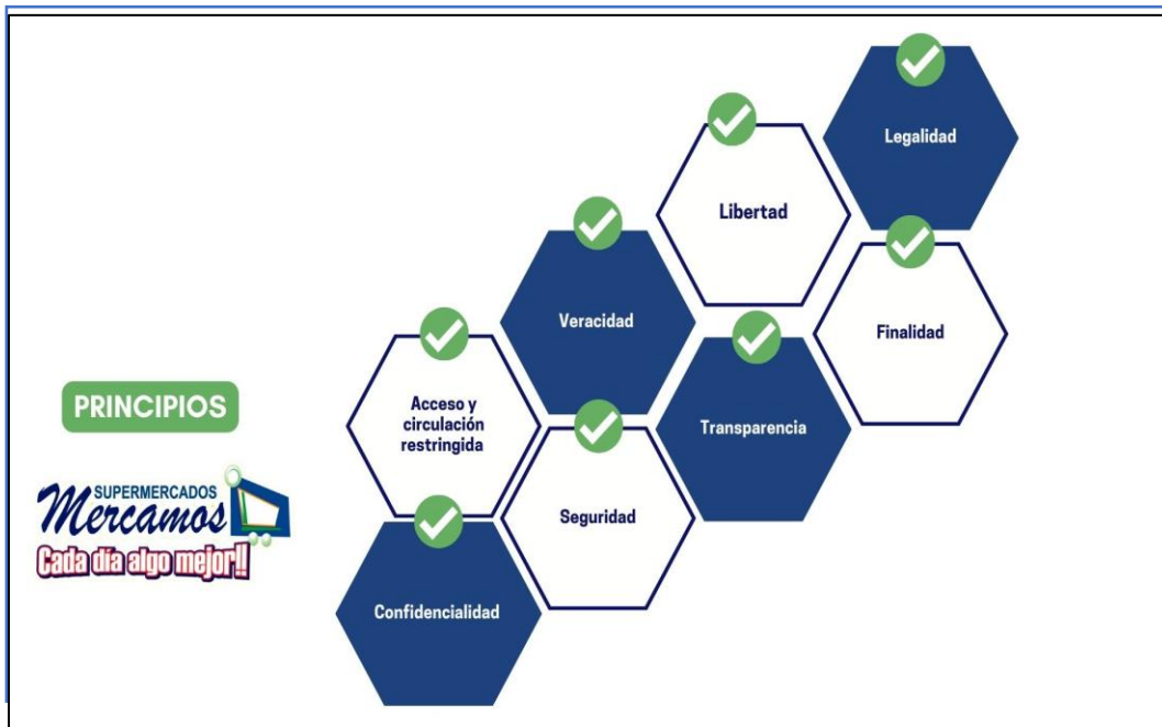
Gráfica 1: Principios Política para el tratamiento de datos personales.

Esta política de tratamiento de datos personales diseñada e implementada por INVERSIONES LATORRE JARAMILLO S.A.S será regida por los siguientes lineamientos o principios, los cuales fueron tomados del Artículo 4 de la Ley 1581 de 2012.