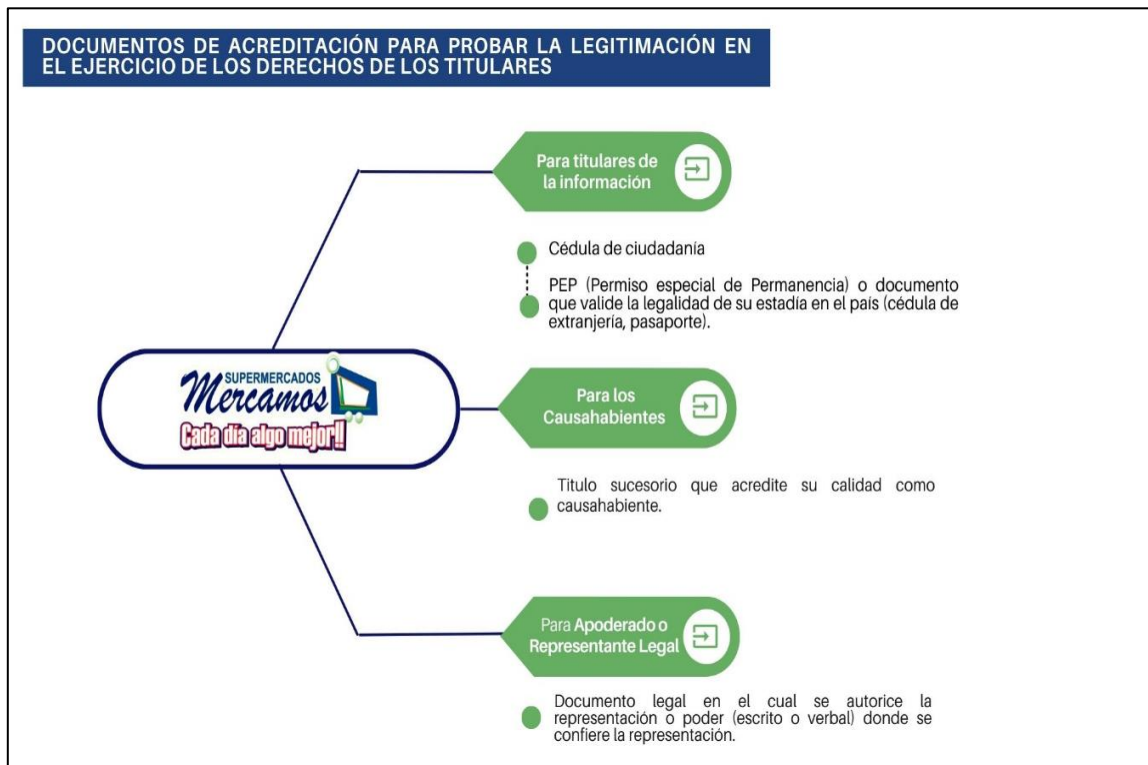
Gráfica 3: Documentos de acreditación para probar la legitimación en el ejercicio de los derechos de los titulares.